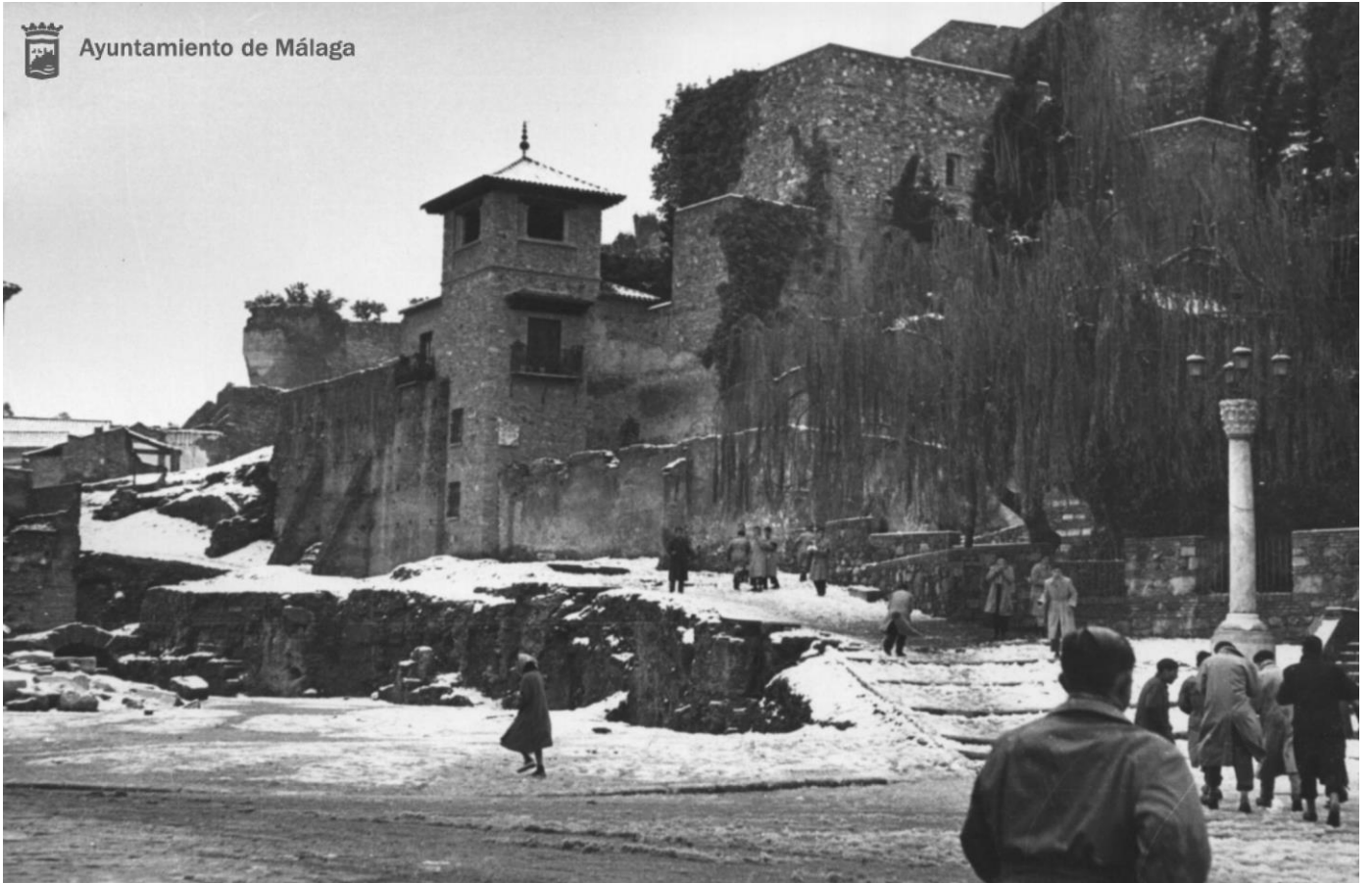
Entrada de la Alcazaba el día de la Nevada de 1954