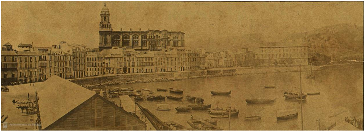
Vista panorámica de Málaga. Puerto y Catedral ca.1860